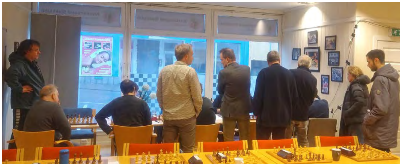
↑ Det varm mange som hvile få med seg spenningen i matchen mellom Molde og Kristiansund.

Romsdal ble spilt hos Kristiansund sjakkklubb. Det var åtte lag med, hvor første-divisjon ble en bykamp mellom førstelagene til Kristiansund og Molde. De spilte to runder, hvor Kristiansund vant 3-2 i første kamp og Molde vant returoppgjøret med samme sifre.