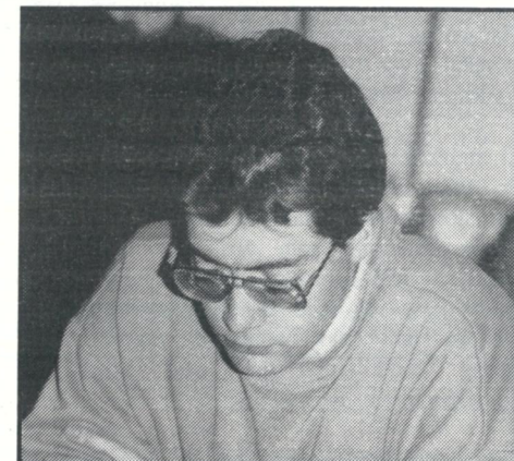
Formannen i Bergens Schakkklub ble beste 2. bordspiller med 4 av 5.